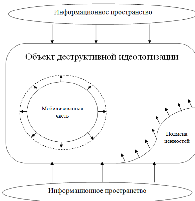
Рис. 1. Схема воздействия деструктивной идеологизации

Схематично рассмотрим пример функционирования деструктивной идеологизации (рис. 1).