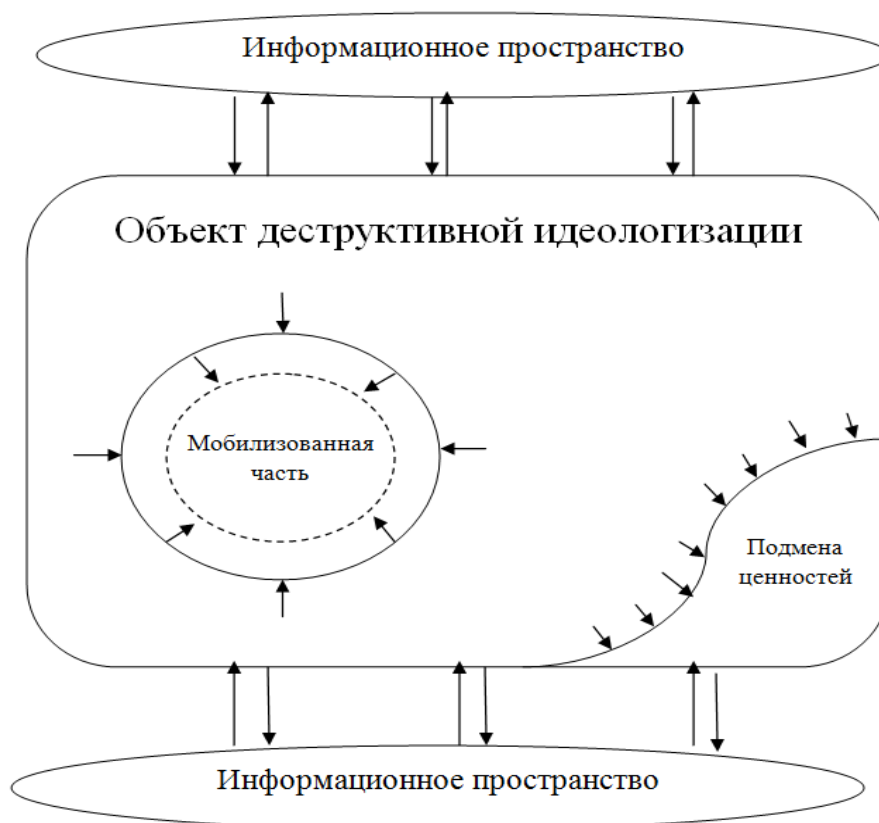
Рис. 3. Схема модели реверсивной идеологизации

2) Мобилизационное воздействие. Часть объекта, которая оказалась восприимчива к деструктивной идеологии и стала её носителем в модели реверсивной идеологизации моментально идентифицируется и начинает подвергаться воздействию самого объекта. Идентификация такой части за счет готовности объекта к деструктивной идеологии и пониманию дальнейших своих действий, т.е. ответной рефлексии. Воздействие на указанную часть оказывается со всех сторон. Целью такого воздействия является постепенная адаптация мобилизованного сегмента и интегрирование его обратно в структуру объекта. Таким образом, мобилизованная деструктивной идеологией часть объекта не только не начинает расширяться, а наоборот становится меньше за счет всесторонней ответной аксиологической рефлексии.